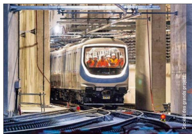
Schnellbahnbau im Großraum Paris – ab Seite 14