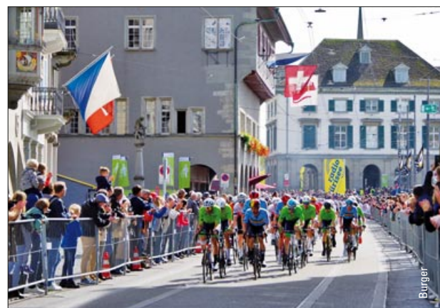
Temporäre Gleisabdeckung in Zürich – ab Seite 4