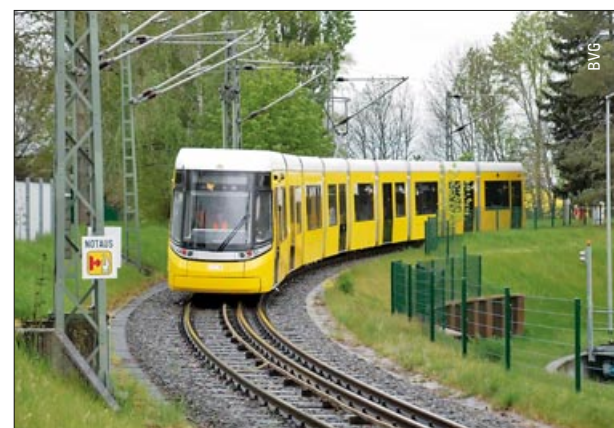
Berlin erhält 50-Meter-Straßenbahnen – ab Seite 49