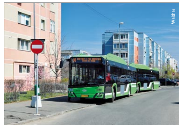
Bukarest erweitert elektrisch betriebenes Netz – ab S. 40