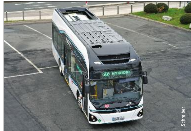
Brennstoffzellenbus von Hyundai – ab Seite 23