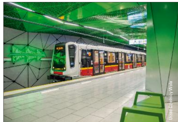
Ausbau der Metro Warschau – ab Seite 50