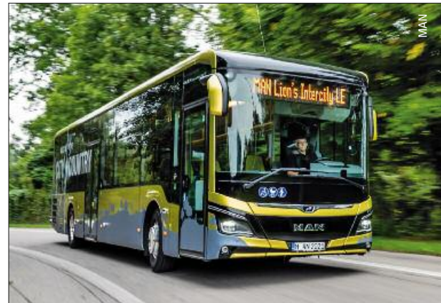
Neuer Low Entry von MAN – ab Seite 4