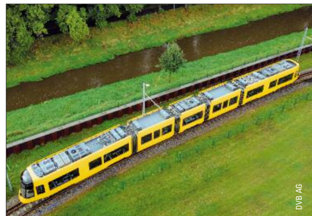
Neue Straßenbahn für Dresden – ab Seite 10