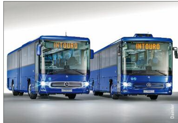
Neuer Überlandbus Mercedes-Benz Intouro – ab Seite 18