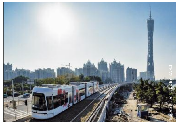
Straßenbahnen in China – ab Seite 26