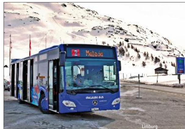
Limburg 20 Jahre Engadin Bus – ab Seite 32