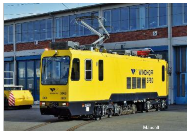
Mausolf Neuer Schleifwagen für die Bremer Straßenbahn – ab S. 30