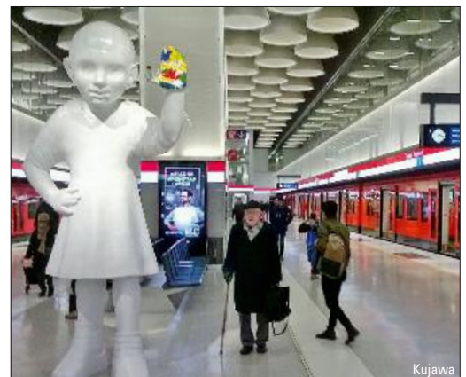
Metro Helsinki nach Espoo verlängert – ab Seite 40