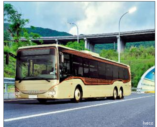
Neue Linienbusse auf der Busworld Kortrijk – ab Seite 6