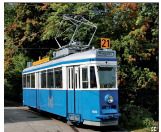
Gab es Schweizer Standardwagen? – ab Seite 34