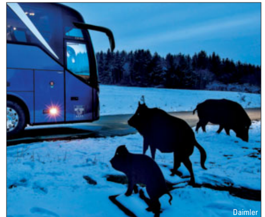
Daimler-Omnibusse mit LED-Scheinwerfern – ab Seite 15