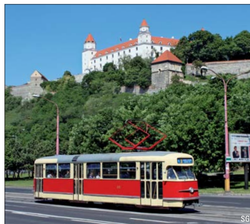
Nahverkehr in Bratislava – ab Seite 6