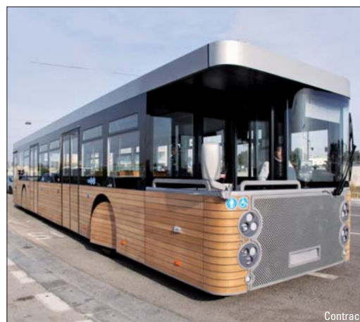
Zweirichtungsbuss für den Mont St-Michel – Seite 51